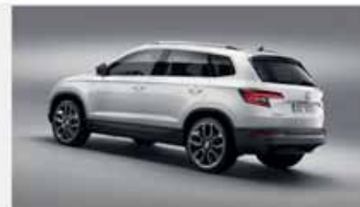
Skoda Kamiq 1.0 G-Tec 66 kw Ambition

48 mesi/1.000 km omaggio Da € 286,00 al mese