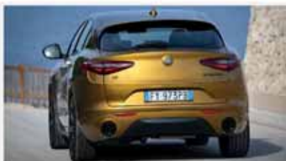
Alfa Romeo Stelvio 2.2 tdi aut. 160 cv Super

48 mesi/1.000 km omaggio Da € 122,00 al mese