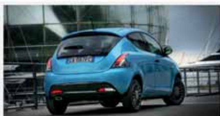
Lancia Y Hybrid 1.0 70CV Gold