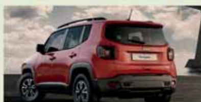
Jeep Renegade 1.6 mjt Longitude

36 mesi/90.000 km compresi Da € 340,00 al mese