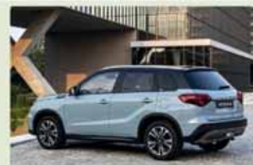
Suzuki Vitara 1.4 Booster Hybrid Cool +

50 mesi/50.000 km compresi Da € 279,00 al mese