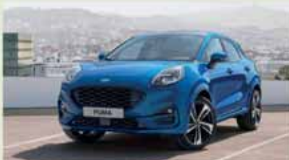
Ford Puma 1.0 Ecoboost Hybrid Titanium

48 mesi/35.000 km compresi Da € 299,00 al mese