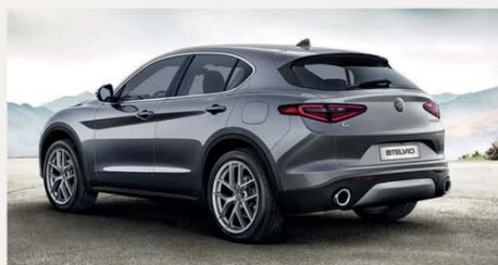
Alfa Romeo Stelvio