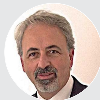
di GIANNI MANCUSO Presidente ENPAV

Contemporaneamente, sottolineo la presenza insostituibile dei “pet” nella vita delle persone e delle famiglie italiane. Il loro ruolo sociale è sotto gli occhi di tutti e genera benessere che produce salute. Anche i Medici Veterinari che si dedicano agli animali d’affezione svolgono una nobile funzione all’interno di quel “patto per la salute” promosso recentemente dal Ministero della Salute.