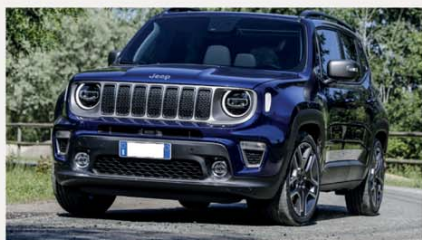
Jeep Renegade 1.6 MJT