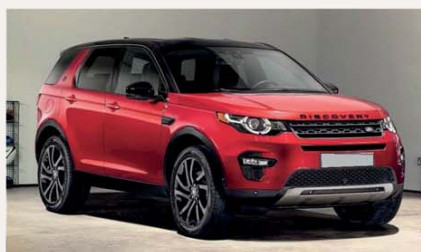
Land Rover Discovery Sport