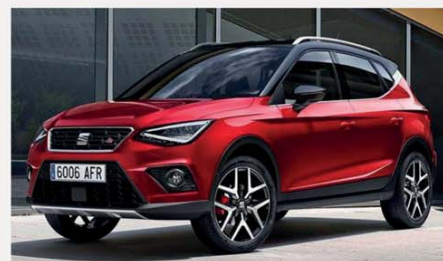
Seat Arona 1.0 TGI Metano