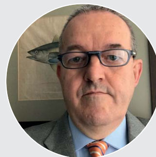
di SIMONE LEGNANI Presidente ANCIT

Per quanto riguarda l'efficientamento dei costi, ricordiamo che il settore delle conserve ittiche - al pari di altri settori del comparto alimentare - concorre al finanziamento dei controlli sanitari ufficiali, in attuazione al Decreto legislativo 19 novembre 2008, n. 194.