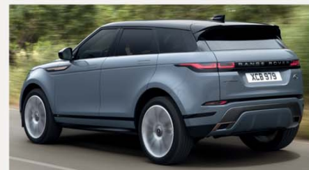
Land Rover Evoque Mild Hybrid