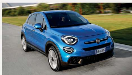
Fiat 500X 1.3 Mjt