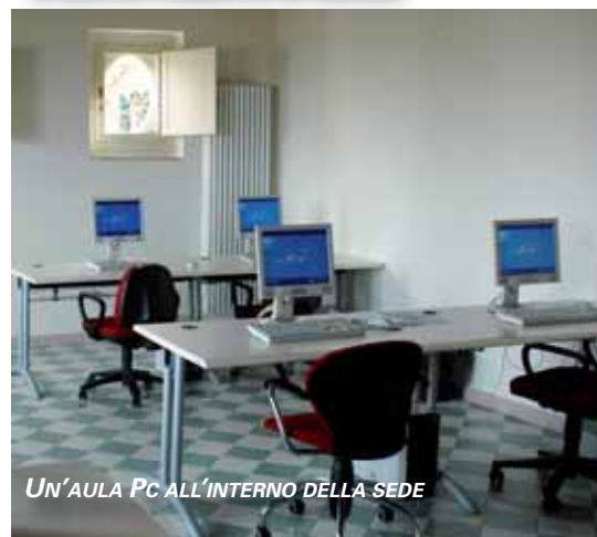
UN'AULA PC ALL'INTERNO DELLA SEDE