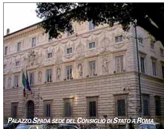
PALAZZO SPADA SEDE DEL CONSIGLIO DI STATO A ROMA

nel caso specifico il Consiglio di Stato - valutare, "alla luce del contesto globale in cui tale codice deontologico dispiega i suoi effetti, compreso l'ordinamento giuridico nazionale nonché la prassi applicativa di detto codice da parte dell'Ordine nazionale dei geologi, se i predetti effetti si producano nel caso di specie". Il giudice deve anche verificare se le regole del codice, in particolare nella parte in cui fanno riferi-