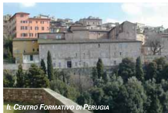
IL CENTRO FORMATIVO DI PERUGIA

Ci si proponeva poi di trovare un equilibrio tra la doverosa difesa dei collegi di Perugia, sede storica e cuore della Fondazione e la sua necessaria dimensione nazionale. L'obiettivo è dunque duplice e contemporaneo: da un canto l'apertura di un Centro Formativo al Sud (la capillare inchiesta condotta tra gli assistiti del