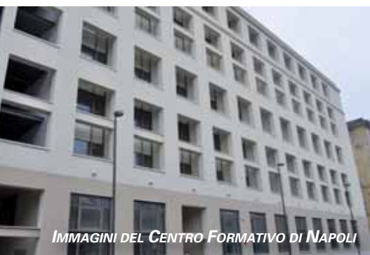
IMMAGINI DEL CENTRO FORMATIVO DI NAPOLI